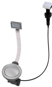
自动下水器 Space 8407 108